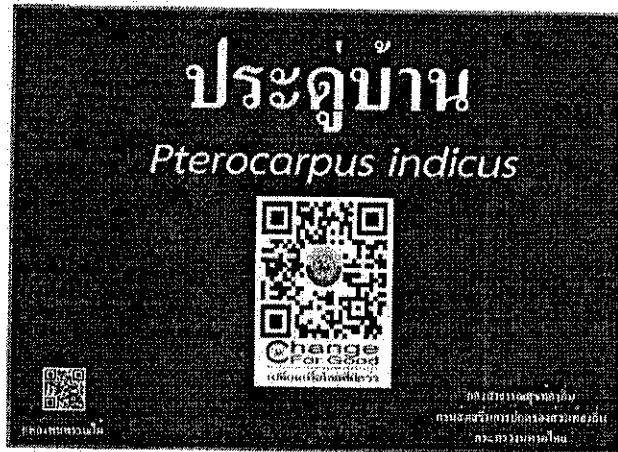
ภาพที่ 1 แสดงรูปแบบป้ายพรรณไม้ท้องถิ่น